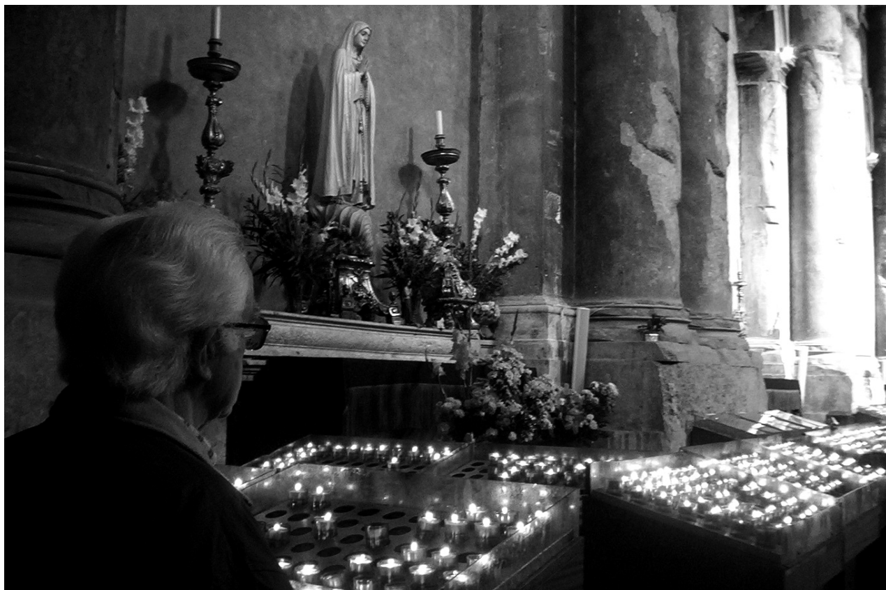
Fotografía: "Hombre que mira a Fátima", de Jorge Carlos Muciño, incluida en la exposición Reflejando los Derechos Humanos: 30 y 40 años. Cortesía de Corte idh.

A partir de la discusión legislativa sobre esa reforma escuchamos los argumentos en favor y las descalificaciones en contra, en ocasiones con un lenguaje común que es utilizado con definiciones distintas; algunos de los conceptos a los que se apela son: justicia, unidad, igualdad, equidad, dignidad, respeto, derechos humanos, solidaridad, matrimonio y ley natural, entre muchos otros.