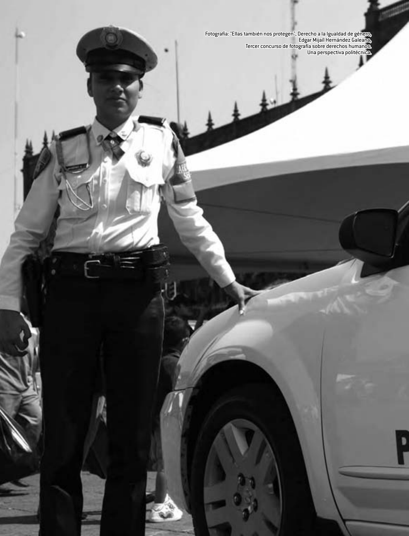
Fotografía: "Ellas también nos protegen", Derecho a la Igualdad de género, Edgar Mijaíl Hernández Galeana, Tercer concurso de fotografía sobre derechos humanos, Una perspectiva politécnica.