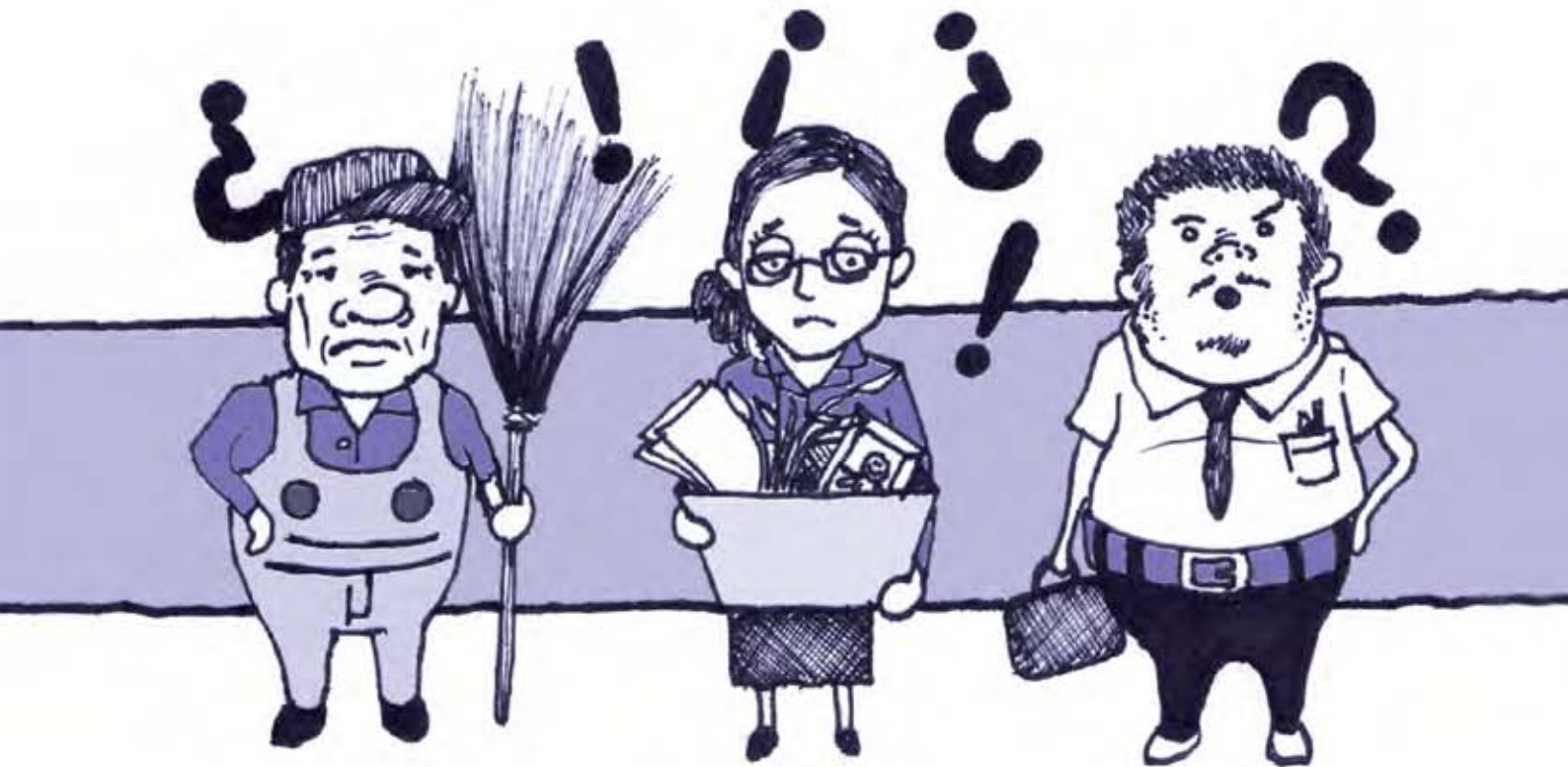
Ilustración: Óscar Vez/CDHDF.

firmar papeles de asociado sin serlo y ello permite que el patrón eluda cualquier responsabilidad laboral. Existe una vieja tesis que permite estos abusos: