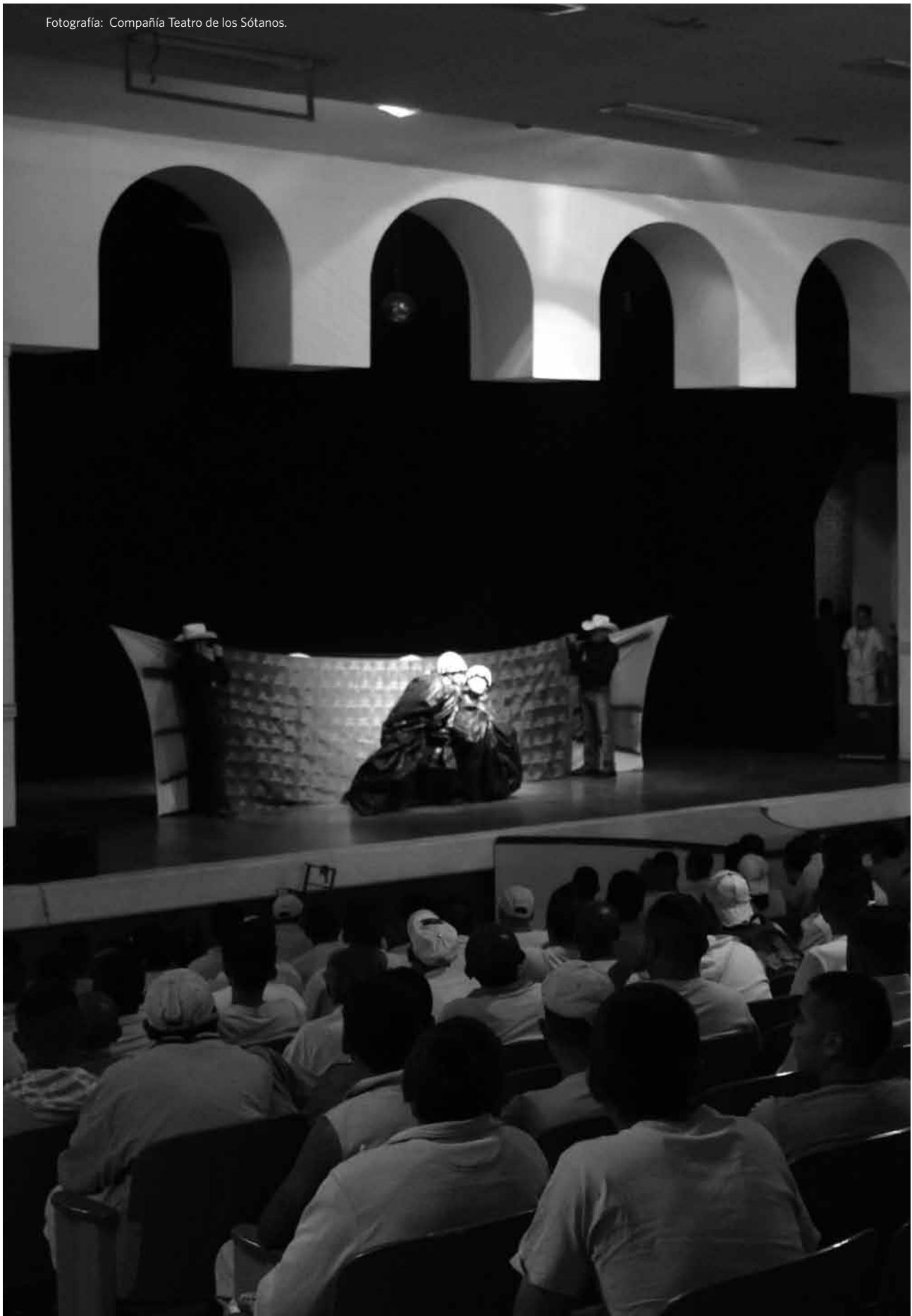
Fotografía: Compañía Teatro de los Sótanos.