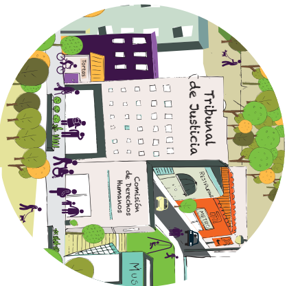
Ilustración y diseño: Gladys López Rojas/CDHDF.

Todas las personas tienen derecho a un recurso efectivo e imparcial, de carácter administrativo y judicial, para defenderse contra actos u omisiones de las autoridades o empresas en el marco de proyectos urbanos que violen sus derechos humanos.